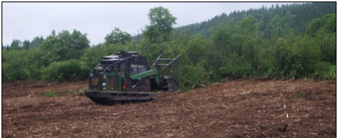
Pour plusieurs propriétaires, l'approche agrosylvicole proposée est une opportunité de réaménager une terre en friche à travers un projet original à forte valeur paysagère

Suite à ces enquêtes, plusieurs des propriétaires ont été contactés afin de mettre en place des essais. Au total, 15 propriétaires parmi ceux ayant manifesté de l'intérêt ont reçu des propositions. De ceux-ci, huit ont donné suite et des systèmes ont été installés sur leurs terres en 2012.