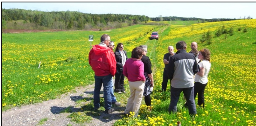
Sortie sur le terrain avec les gestionnaires municipaux : l'occasion d'échanger et de recueillir des commentaires

Tous s'entendent sur l'importance de la prise en compte du paysage dans les choix d'aménagement des terres et sur l'impact positif que peut avoir l'agrosylviculture à ce niveau. Leurs avis étaient plus contrastés sur la faisabilité de la mise en oeuvre de l'approche. La disponibilité du support financier apparaît comme une contrainte importante pour plusieurs d'entre eux, ainsi que la faisabilité d'établir des partenariats durables entre propriétaires et agriculteurs. La majorité du groupe voyait toutefois dans l'agrosylviculture un outil pour atteindre des objectifs de développement territorial.